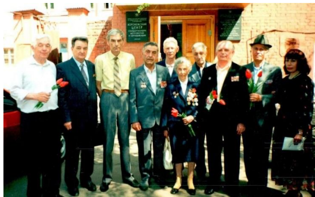
Встреча с ветеранами войны. 2002 г.