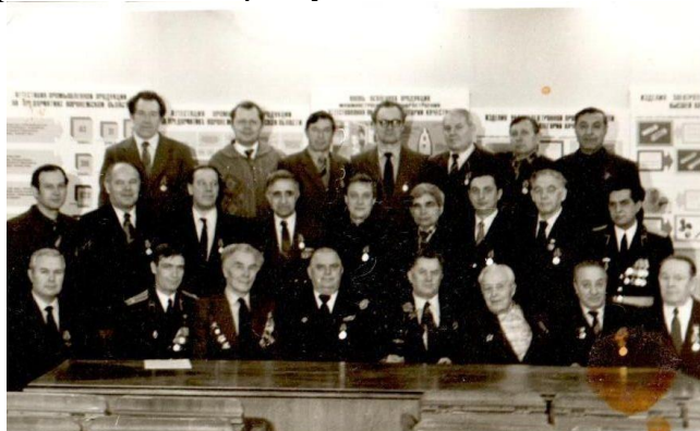
Ветераны войны – сотрудники Воронежской ЛГН. 1980 г.

4. В 2021 году впервые на сайте центра организована онлайн-акция «Бессмертный полк», где сотрудники размещали фотографии и рассказы о своих родственниках-ветеранах, а также работниках центра – участниках ВОВ.